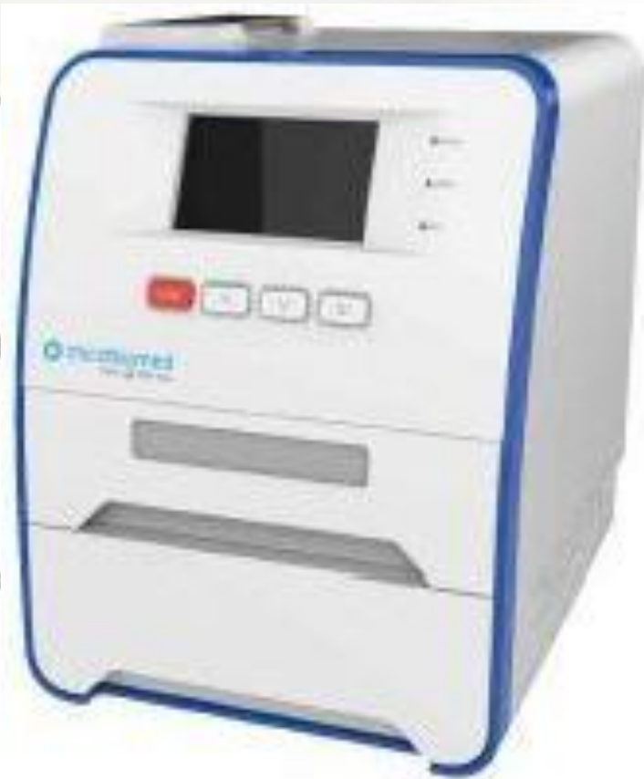
Automatic Nucleic Acid Extractor